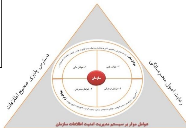
شکل ۱- مدل مفهومی پژوهش، عوامل‌های نرم و سخت موثر بر سیستم مدیریت امنیت

در این پژوهش با توجه به مبانی نظری و پیشینه مطالعات صورت گرفته و مصاحبه با متولیان امر و محدودیت‌های محقق در سازمان مورد نظر، عوامل نرم موثر بر سیستم مدیریت امنیت اطلاعات در قالب دو دسته کلی عوامل فرهنگی/اجتماعی و عوامل مدیریتی و عوامل سخت نیز در دو دسته، عوامل فنی/فناورانه و عوامل مالی طبقه‌بندی شده‌اند. شکل ۱ مدل مفهومی این پژوهش را نشان می‌دهد.