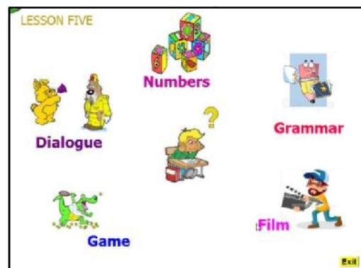
شکل ۱. نمای اصلی چندرسانه‌ای آموزشی محقق ساخته.